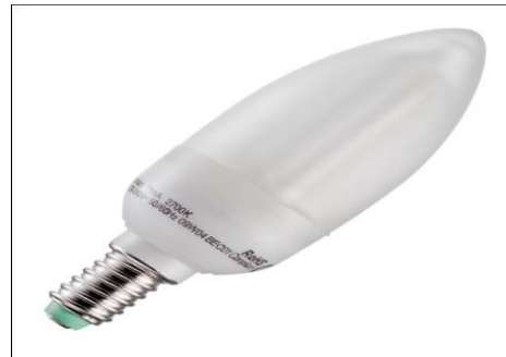
Compact fluorescent lamps with bare tubes and with bulb-shaped outer lamp envelope