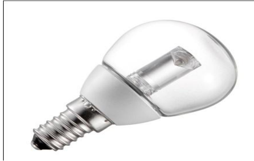
Decorative light-emitting diode (LED) lamp with clear bulb